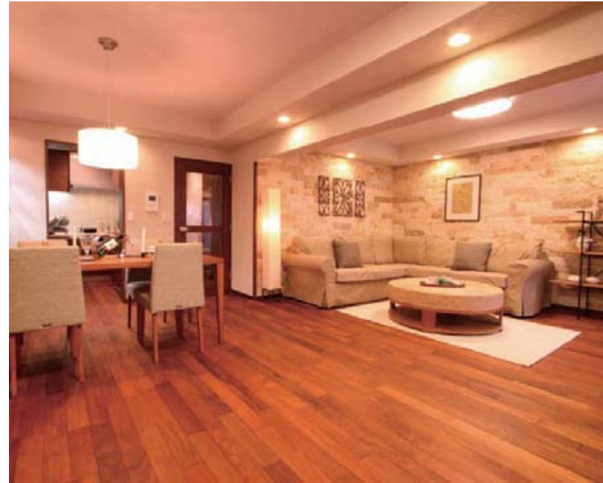
高級ホテルのスイートルームをイメージした広いリビング・ダイニング。深みのある無垢材と天然石をコーディネート（施工例）