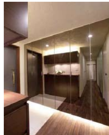
鏡面仕上げの建具にして広さを演出（A氏邸）