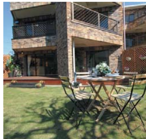
ほどよく光を運る庇との一体感を大切に、マンション一棟をリニューアル（施工例）